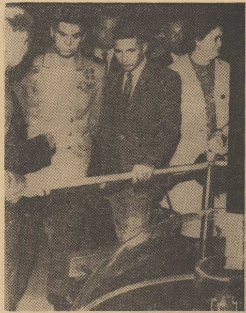
KOSMONAUCI radzieccy gen. G. Bieriegowoj i K. Fieokistow, którzy kończą już swoją wizytę w USA — podczas zwiedzania Waszyngtonu 1 bm. oglądają próbki gruntu księżycowego.