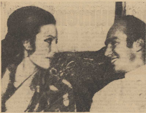
28 bm. odbył się ślub najbogatszego człowieka świata Agi Khana z brytyjską arystokratką lady Sarah Cringhton Stuart.