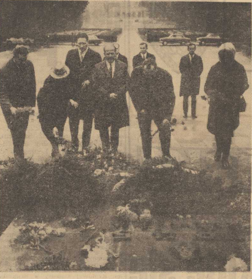
NA ZDJĘCIU: moment składania kwiatów na Cmentarzu Centralnym.

„WIDNOKRAG”... „Rozpocznijmy cykl pt. „ZAWIĘZKI ROZWOJU” poświęcony zapamiętaniu pochodzenia człowieka. W tym samym magazynie (28. bm. g. 18.20, progr. II) usłyszycy część I „LISTOW Z PAWIAR” poświęconych służbie łączności wieziennej w okresie okupacji. W „Widnokragu” w dniu 30 bm. o 18.20, progr. II nadana będzie druga audycja w cyklu „Zawieź drogi rozwoju” i druga część „Listów z Pawiar”. Z CYKLU AUDYCYJ LITERACKICH... „Warto zwrócić uwagę na „PORTRET LITERACKI” (28. bm. g. 14, progr. I) poświęcony Marii Kanciszewskiej w związku z 70 rocznicą jej urodzin, słuchowski pt.