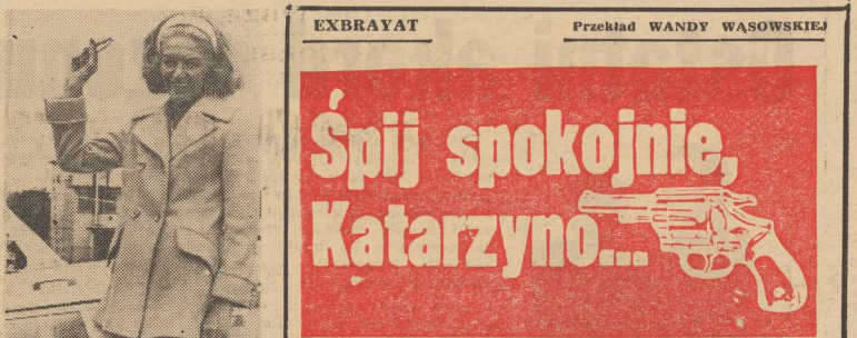
EXBRAYAT Przekład WANDY WĄSOWSKIEJ