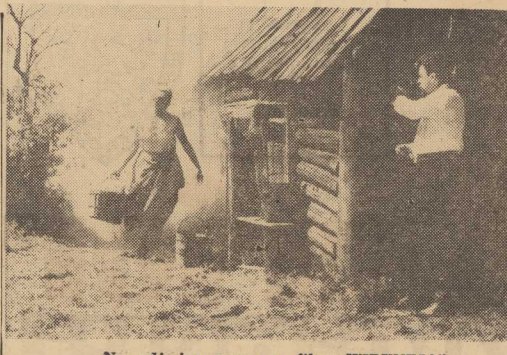
Na zdjęciu: scena z filmu „WIRYNEJA“.