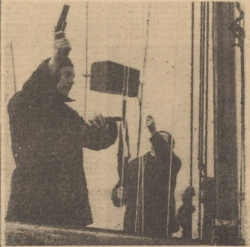
RAKIETA w górę! Regaty rozpoczęły...

MUZEU — Staromysłska 27 — sztyka Pomorza Zachodniego XII-XVIII w. XX lat Galerii Sztuki Polskiej i renesansowe stroje kłazat szczeńskich g. 9-15. WALY CHROBREGO — Muzeum w Polsce nad Bałtykiem, przed 1000 lat; Wystawy marynistycznej Prehistora Pomorza Zachodniego; Przyroda; Kultura Artystki Zachodniej; Z dziełow kowalstwa, monet i rzeźmisk pokrewnych na Pomorzu Zachodnim; W wystawa polskiej grafiki marynistycznej g. 9-15. ZAMEK — Wystawy bulgarskiej Plastyka, architektura i fotografia woj. rostockiego. BWA — ZAMEK — „Ścieżki do Sztuki” Bielsko-częstochowska g. 10-18. „12 MUZY” — pl. Żołnierza 2 — Malarswo, Bogmy Szymkowskiej, PIWNICA — al. Niepodległości 19 — Malarswo Waduwca Oneka.