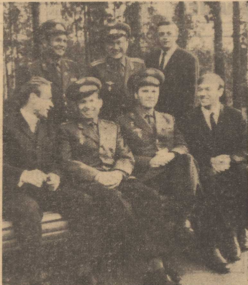
NA ZDJĘCIU: członkowie załóg radzieckich statków kosmicznych SOJUZ-6, SOJUZ-7, SOJUZ-8. Od lewej: siedzą — W. Kubasow, G. Szonin, W. Szatałow i A. Jelisiejew. Stoją: W. Gorbatko, A. Filipczenko oraz W. Woikow.

Wczoraj załoga statku „Sojuz-6” spożyła w czasie drugiego okrążenia Ziemi śniadanie. Składało się ono z pieczywa, chleba, czekolady i soku porzeczkowego. Obiad załogi statku „Sojuz-6” składał się z suszonej ryby, paszety, mięsa kurzego, chleba i suszonych śliwek, a obiad załogi statku „Sojuz-7” z mielonego mięsa, cięciyny, chleba i herbatników.