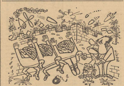
— JESZCZE tylko trochę trzymajcie front, chłopcy, później on będzie trzymał!

Jeśli chodzi o dzielnicę Marais, to po wielu latach dyskusji wysunięto projekt stałej konserwacji tej zabytkowej dzielnicy. Plany będą poddane pod dyskusję parlamentarną.