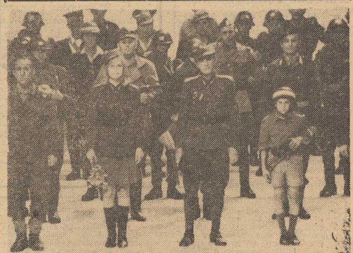
ZDJĘCIE NR 4