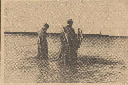
ZDJĘCIE NR 3