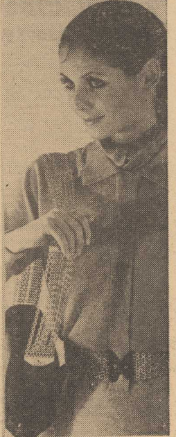
Torebka popołudniowa z pakciem z łańcuszków. Identyfikacyjny pasek z łańcuszków.