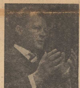
NA ZDJĘCIU: Willy Brandt, który stanie na czele nowego rządu NRF.

FRAKCJA parlamentarna FDP głosować będzie jedynomyślnie za inwestycją Willy Brandta na kanclerza — oświadczył w czwartek wieczorem przewodniczący FDP, Walter Scheel, podczas przerwy w rokowaniach koalicyjnych komisji FDP i SPD. Oświadczeniem swym W. Scheel obalił wątpliwości, jakie powstały na temat zwartości frakcji parlamentarnej wolnych demokratów wobec koalicji z SPD.