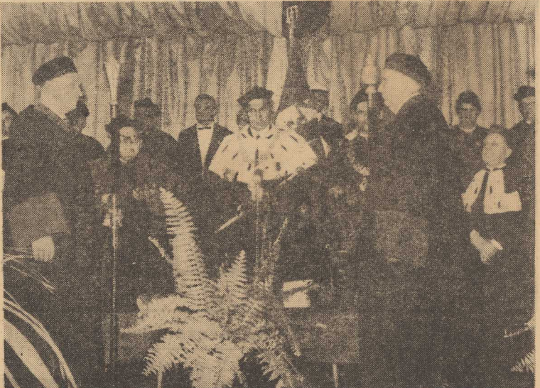
NA ZDJĘCIU: moment ślubowania doktorskiego w Wyższej Szkole Rolniczej.

Polscy koszykarze przegrali z CSRS 69:75 (30:32). POLSKIE siatkarze, które występują w mistrzostwach Europy juniorów rozgrywanym w Rydze, odniosły w pierwszym swym meczu finałowym piękny sukces, wygrywając z Węgrami 3:2. W DALSZYM ciągu mistrzostw Europy w siatkówce juniorów reprezentanci Polski pokonali Holandijkę 3:3.