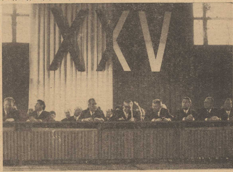
NA ZDJĘCIU: prezydium akademickie.

Jak wiadomo, samolot „Concorde” ma wejść do eksploatacji w 1974 roku i będzie mógł osiągać szybkość około 2 300 km na godzinę.