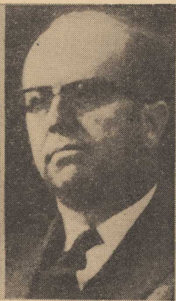
26 bm. dokonano w Boliwii przewrotu wojskowego. Grupa wyższych oficerów z gen. Alfredem Ovando Canđia na czele obaliła prezydenta Adolfo Siles Salinas i jego rząd.

Na zdjęciu: z lewej Alfredo do Ovando Canđia, z prawej były prezydent Adolfo Siles Salina.