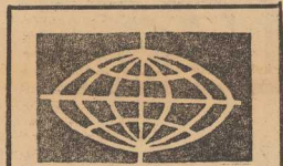
DEPEZA PAPIEZA PAWŁA VI DO KRÓLA HASANA II

Jak już powiedzieliśmy, pozornie wygląda, że nie się po wyborach nie zmieniło. W rzeczywistości jednak wyniki wyborów mogą w najbliższych dniach spowodować znaczne zmiany polityczne w Norwegii. Przede wszystkim utrata przez liberalną partię „Venstre” aż 5 mandatów osłabi pozycję tego stronnictwa w koalicji rządowej, dodajmy pozycję już i tak niechętną mocną. Zresztą liberalowie byli w tej koalicji ciałem dość obcym, ich program różnił się znacznie od linii politycznej pozostałych partnerów koalicyjnej, jest natomiast znacznie bliższy programowi socjaldemokratów, zarówno w dziedzinie polityki wewnętrznej jak i zagranicznej. Liberalowie byli np. przeciwni proponowanej przez rząd koalicyjny reformie systemu podatkowego w Norwegii. Nie jest