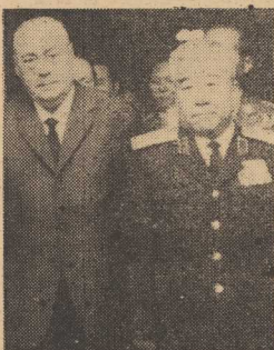
PREMIER Józef Cyrankiewicz przyjął przebywającego w naszym kraju ministra obrony narodowej KRL-D, gen. armii Czaj Hion.

Minister sprawiedliwości USA, Mitt chell, występując niedawno na posiedzeniu Podkomisji Senackiej do spraw przestępczości nieletnich, poinformował, że ponad połowa aresztowanych w ub. r. narkomanów — to młodzież w wieku do 21 lat.