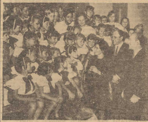
NA ZDJĘCIU: spotkanie w Palacu Młodzieży.