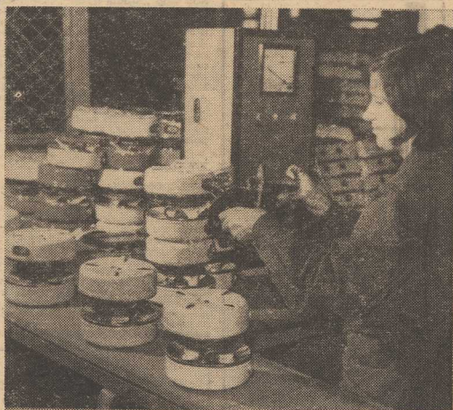
NA NASZYM ZDJĘCIU: stanowisko kontroli technicznej w „Selfie”, gdzie sprawdza się jakość kuchetek elektrycznych.

reorganizacja systemu przyjęć pacjentów w laboratoriach zyska uznanie przede wszystkim u samych pacjentów. Ludzi chcących, niestety z wysoką temperaturą dla których długie wyczekiwanie w poczekalniach staje się prawdziwą torturą.