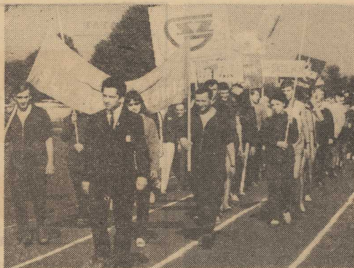
ZMAGANIA lekkoatletów poprzedziła uroczystość otwarcia V Turnieju Najlepszych.

Start imprezy był udany. Turniej szachowy był najciekawszy z dotychczas rozegranych, ciekawy przebieg miały zawody kajakowe, które były bardzo sprawnie zorganizowane, i dobrze przygotowane. Natomiast zawody lekkoatletyczne przeszły oczekiwania inicjatorów i organizatorów. Była to bowiem impreza gigantyczna, prawdziwy maraton. Mały stadion SKL przeżywał w niedzielę wielkie dni. Tak dużej liczby startujących i oglądających zawody dawno tu nie widzia-