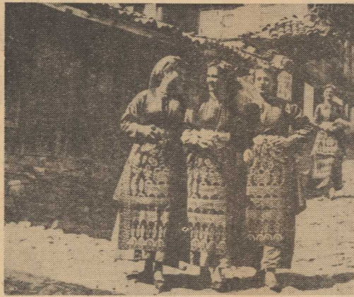
DZIS święto narodowe Ludowej Republiki Bułgarii. Na zdjęciu: dziecięcy w strojach ludowych z okręgu Kotel we wschodniej Bułgarii.