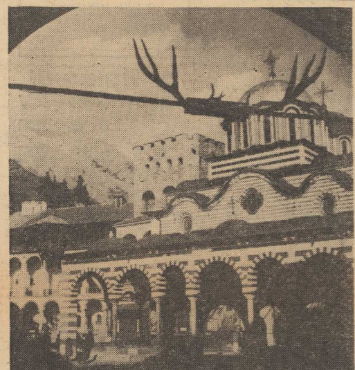
MONASTYR W RILE