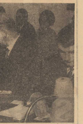
(Dokończenie ze str. 1)

Zastępuj sobie na zastępczym miano oca piśmiennictwa pol-skiego. Zmarł czterysta lat temu, a więc dobra sposobność do przy-