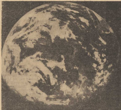
Agencja TASS opublikowała zdjęcie Złota zachodzącej za księżycowy horyzont. Zdjęcie to wykonano 11 bm. kamerą zamontowaną na automatycznej stacji księżycowej „Sonda-7” w momencie, gdy stacja znajdowała się w odległości 2 tys. km od Księżyca.