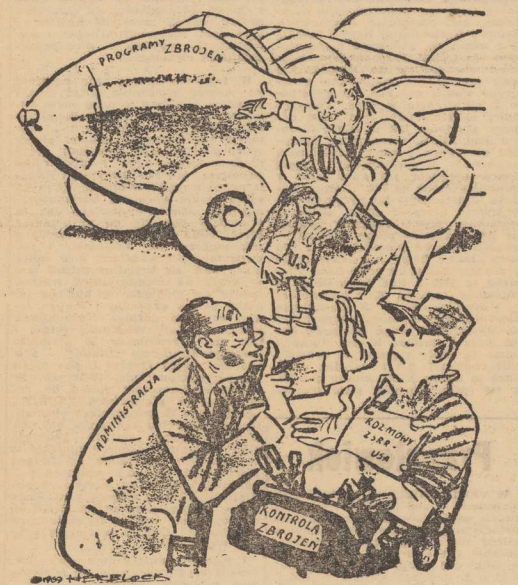
Na razie zbrojenia... Zaraz potem będziemy rozmawiać...

KAIR PAP. W stolicy Tanzanii, Dar es-Salam, wprowadzono racjonowanie wody. Od lat miasto od czuwa poważny niedobór wody pitnej, lecz w tym roku sytuacja jest wyjątkowo groźna. Dwa z trzech rezerwuarów wody pitnej wyschły całkowicie.