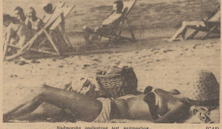
Nadmorska opalenizna jest najtrudniejsza...