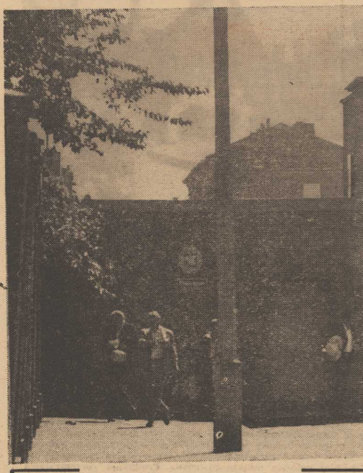
KOLEJNA GRUPKA opuszcza bramy więzienia - jedynym miejscem, gdzie niekiedy jest powiedziane: „Do widzenia...”

Na ogół nie zastanawiamy się nad tym, jak ważne są liście i różnorodność wieści, które z różnymi ludźmi, z otaczającym światem. Przymusowe odosobnienie zrywa wiele tych wieści. Czołowiek, który zbliżył i został osadzony, miał okazję wiele przemysleć i zrozumieć, często stał się lepszy, dojrzałszy. Gdy po wyjściu z więzienia zamykał drzwi, wyczuwał, że w nurt normalnego życia, stwierdza niekiedy z przerażeniem, że wszystko w powrocie do społeczeństwa, ROBYMY TO NA SZEROKA SKALĘ. Celowi temu służy cały szereg środków pomocy postpenitenciarnej, dzięki której każdy, kto opuścił więzienie, ma szansę, że nie jest pozostawiony własnemu losowi, że żyje w atmosferze, która pomoże ominąć zdradliwe rafy.