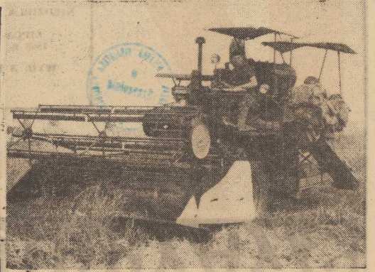
Małe żniwa w pełni