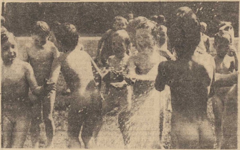
Upał na „102“ - trzeba się trochę ochłodzić...

WARSZAWA PAP. Ułubieniec młodzieży Czesław Niemen-Wydrzycki nie otrzymał zaproszenia na festiwal w Sopocie. Będzie natomiast śpiewał na przefestiwalowych koncertach, organizowanych tam przez Polską Federację Jazzową.