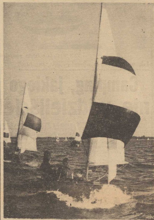
Żeglarzom życzymy pomyślnych wiatrów. Tar.

MALY port trzebieżskiego ośrodka szkolenia żeglarskiego okazał się bardzo pojemny - znalazło w nim schronienie blisko 150 żaglówek. Są to w większości jachty wysokiej klasy, nic zresztą dziwnego star-tować na nich będą prze-wynosiła 60 mil. Do późnych godzin wieczornych żaden jacht nie przy-był na miejsce. Doświadczeni rary-nym w Świnoujściu i Trzebieży od-