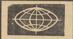
FLAGA FWN NA WIEZY NOTRE DAME

W niedzielę rano paryżanie ujrzeli na blisko stumetrowej wieży katedry Notre-Dame powiewającą flagę Narodowego Frontu Wyzwolenia Wietnamu Południowego.