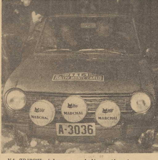
NA ZDJĘCIU: jeden z samochodów rajdowych opuszcza punkt

W NIEDZIELĘ rano wszystkie załogi, które przejechały przez Polskę, a więc 12 z Warszawy i 20 z Oslo zameldowały się w oznaczonym czasie w Punkcie Kontroli Czasu w Pradze. Rajdowcy, po krótkim odpoczynku, ruszyli w dalszą drogę.