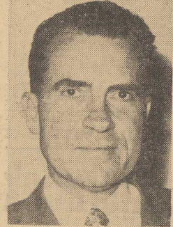
datowi jego partii. Historia ta jest więc dla Waszyngtonu dramatyczną nauką na przyszłość i trzeba żywić nadzieję, że zostanie ona uwłasniony sposób zrozumiana przez nowego lokatora Białego Domu.

Oficjalnym obchodom towarzyszyć będzie antywojenna demonstracja, organizowana przez tzw. komitet narodowej mobilizacji na rzecz zakończenia wojny w Wietnamie.