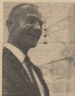
Trzej amerykańscy astronauta: Aldrin, Armstrong i Collins.