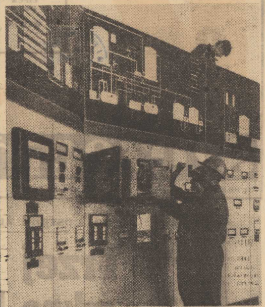
KOMBINAT CHEMICZNY w Policach będzie nowoczesnym, w dużej mierze automatyzowanym zakładem. Stąd też już w trakcie obecnie prowadzonych robót przy Wytwórni Kwasu Siarkowego instalowane są urządzenia, które umożliwiają kierowanie procesem produkcyjnym. M. in. ekipy „Energoaparatury” z Katowic montują urządzenia Centralnej Sterowni, gdzie dziesiątki zegarów pomiarowych i sygnalizacja świetlna zapewnią możliwość zdalnego kierowania i zabezpieczenia przebiegu produkcji w całym kombinacie. Dziesiątki przewodów i kolorowe guziki, to zewnętrzny wyraz tej skomplikowanej, nowoczesnej sterowni - gdzie ubrani w białe fartuchy technicy będą śledzić przebieg pracy na wszystkich działach tego rozległego obiektu przemysłowego.