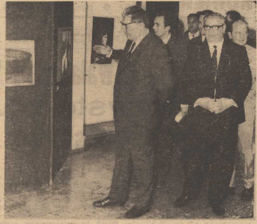
NA ZDJĘCIU — goście zwiedzają wystawę. Po lewej — fragment ekspozycji.