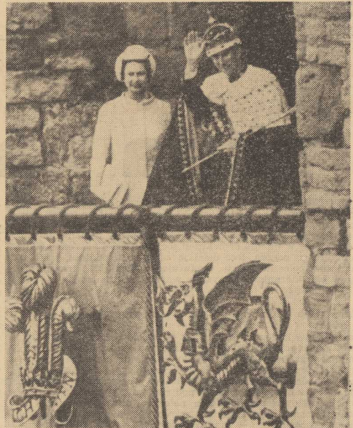
NA ZDJĘCIU: królowa brytyjska Elżbieta II wraz z synem Karolem podczas ceremonii.

Plenum przyjęło jednomyślnie uchwałę w związku z dyskusyjnymi problemami.