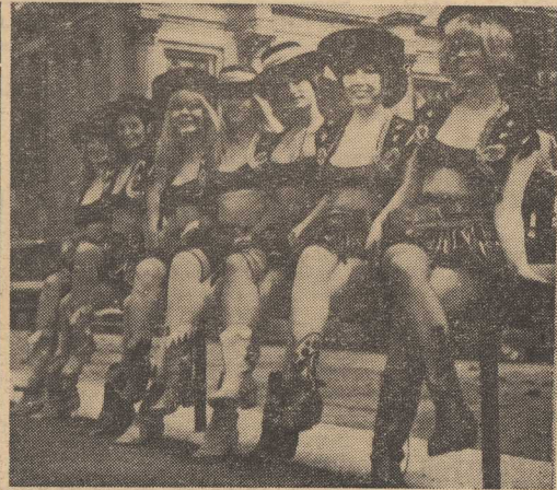
TYCH SIEDEM kolorowo i kuso ubranych „koubojek” jest żywą reklamą amerykańskiego westernu „REWOLWERY WSPA NIALEJ SIÓDEMKI”, którego premiera odbyła się 27 ub. m. w Londynie.