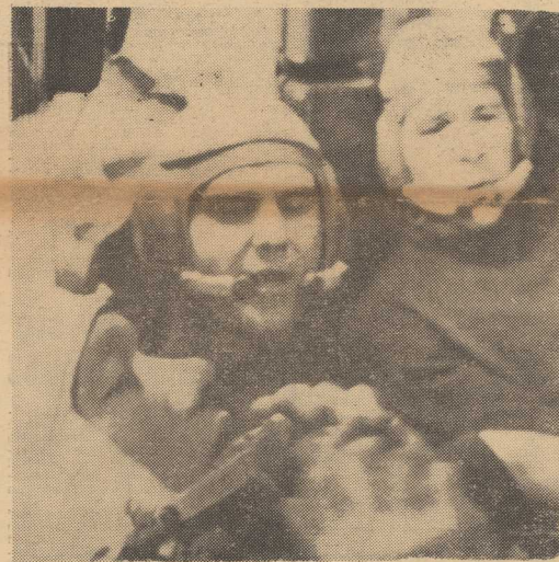
Na zdjęciu: kosmonauci (od lewej) A. Jelisiejew, W. Szatałowa i E. Chrunow.

Przyjaciele i dziennikarze powitali trzech kosmonautów zdrowych i szczęśliwych „Sojuz-5“ nadal na orbicie