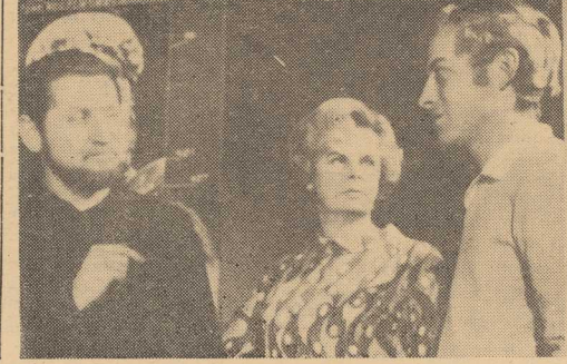
Kto zgubił? Leżytnym ucznia Szkoły Podstawowej nr 1 przy al. Wojska Pol- skiego, budynku PZU przy ul. Ma- tejki KW MO od strony ul. Puł- k. Starzyńskiego. Najgorzej wygląda chyba sytuac- ja na Bulwarze Gdynskim, którzy chodzą do pracy pracownicy PFD i UR przy Zakładach Mięsnych. Kto właściwie powinien dbać o czy- stość chodników przy budynkach, zajmowanych przez przedsiębior- stwa? Dłazył gospodarz, a może sami pracownicy mogliby pomóc trochę w sytuacjach awaryjnych... Podobnie rzecz ma się z placami i parkami w mieście, nad czy- stością których w lecie czuwają pracownicy Zarządu Zieleni Miejskiej. A żaden nikt właściwie o nie nie dba. Zapominano również o oczyszczaniu studnierek ściekovo- wych. (jas)

Tak więc już w najbliższych dniach będziemy mogli nabywać w szczecińskich sklepach twarogi tu- stej, kremowe i chude w estetycz- nych i praktycznych opakowa- niach. (kk)