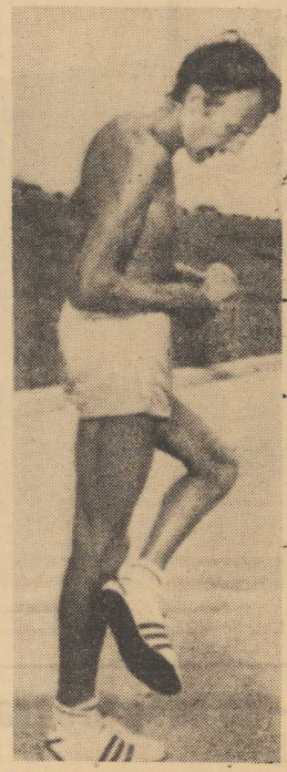
33-LETNI biegacz brytyjski Bruce Tulloh postawił przed sobą dystans 2 830 mil z Los Angeles do Nowego Jorku w 66 dni. Na zdjęciu: Tulloh odpoczywa na trasie.