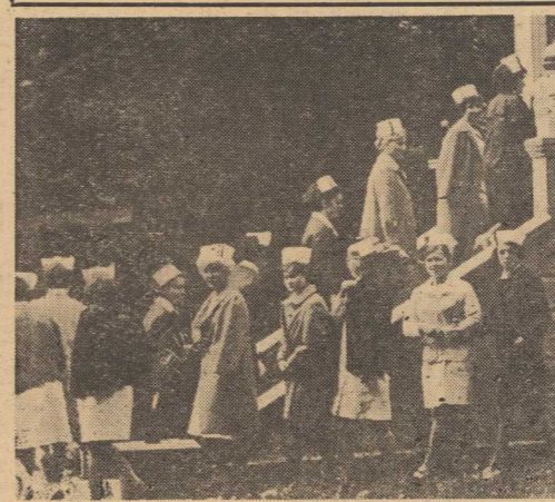
UCZENNICE II Szkoły Medycznej Pięlegniarstwa udają się do lokalu wyborczego.

można było pełnić służbę harcerzy i ZMS-owców. Wska zypała oni wyborcom drogę, udzielali niezbędnych informacji i opiekowali się dziećmi pozostawionymi przez rodziców przed budynkami.