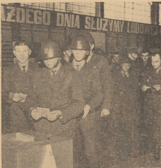
GŁOSUJĄ żołnierze 5 Kołobrzeskiego Pułku Zmechanizowanego.

— „Maś idźcie teraz do pracy, bo ma dyżur, a przed przystąpieniem do niej chciał wywiązać się ze swego obywatelskiego obowiązku, dać wyraz temu, że popiera program FJN. Chciełmy oddać swe głosy razem,