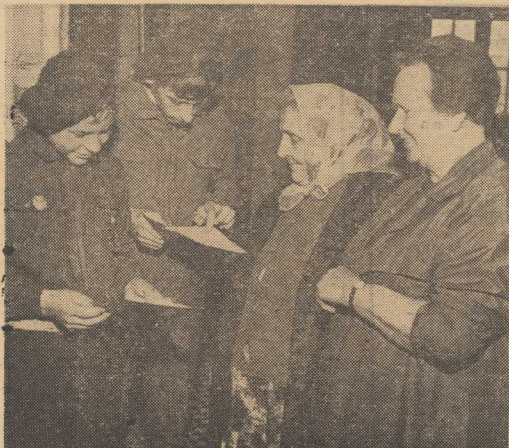
PODCZAS wczorajszych wyborów niezwykle aktywnie spisał się szczeciński harcerze, sclinając w łokalach wyborczych wiele porządkowych i organizacyjnych prac.