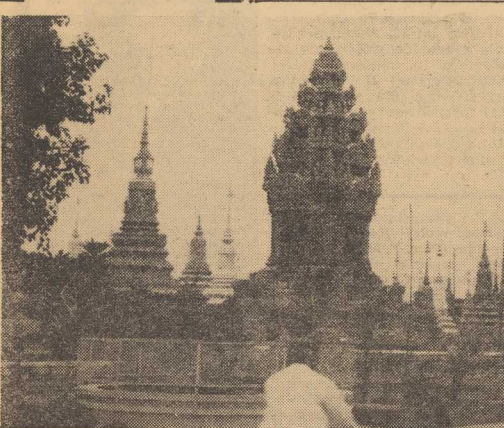
KAMBODŻA. Na zdjęciu: grobowce w pobliżu Srebrnej Pagody w Phnom Penh.

LONDYN. Brytyjska firma Colour Video Services oferuje urządzenie do rejestrowania kolorowych programów telewizyjnych. Urządzenie umożliwia wykonywanie wysokiej jakości filmów z kolorowych programów telewizyjnych, zarówno transmitowanych „na żywo”, jak i odzwierczonej z nagrań. Brytyjczycy mają nadzieję, iż zastosowanie aparatu wy różniącego się pewnością pracy, jakością, szybkością zapisu i niskimi kosztami umożliwi eksport kolorowych brytyjskich programów telewizyjnych.