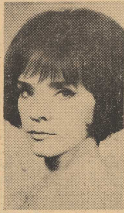
NA ZDJĘCIU: jedna z gwiazd polskiej estrady — Sława PRZYBYLSKA.

JEST w naszym mieście wiele pięknych i starannie zagospodarowanych skwerów i zielonych. Duża to zasługa pracowników ZSM. Niestety, jest także wiele miejsc, gdzie mimo początków lata nie zrobiono jeszcze nic dla upiększenia skwerów. Najbardziej drastycznym przykładem tego jest olbrzymi trawnik przy pl. Mickiewicza. Jest to miejsce na którym rośnie dziko trawa, a gdzie teren ten zamieniany w białko. Dziwi nas to, bo w latach poprzednich w tym właśnie miejscu trawniki były utrzymane wzorowo, a na kłombach