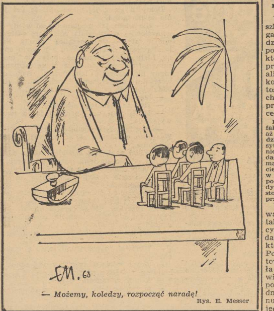
EM. 68 — Możemy, koledzy, rozpocząć naradę! Rys. E. Messer

W JOKOSUKA w Japonii ma powstać nowa stocznia, w której pierwsze położenie stępki statku przewiduje się na początek 1972 r. Stocznia będzie wyposażona w dwa duże doki dla statków o 300 i 500 tysięcy ton nośności.