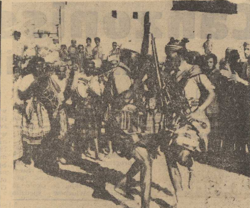
OBIEKTYWEM PRZEZ ŚWIAT — Ludowa Republika Południowego Jemenu. Na zdjęciu: taniec ludowy.

Sam Hoover z młodego człowieka o poglądach konserwatywnych lecz umiarkowanych przerodził się w „zoologicznego” antykomunistę i zaciekłego wsteczniaka. Tylko na skutek jego weta nie doszło np. do realizacji planowanego od lat i akceptowanego zarówno przez par-