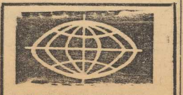
DNI POLSKIEJ KULTURY W CSR

Michel Rocard, sekretarz krajowej rady ułanowskiej Związku młodej Partii Socjalistycznej PSU;