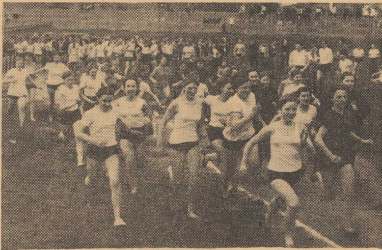
Na zdjęciu: Fragment biegów w technikum przy ul. Sowińskiego.