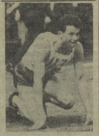
We wtorek zakończyły się w Zabrzu mistrzostwa Polski w lekkoatletyce. Uzyskano na nich wiele dobrych wyników.

Związek Młodzieży Polskiej przystąpił do przeprowadzania ZMP-owskich marszów patrolowych.