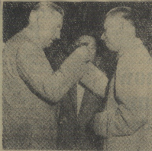
Na zdjęciu: I sekretarz KC PZPR Edward Ochab w rozmowie z sekretarzem KC KP Chin Lin Szao-tsi w czasie przyjęcia wydanego przez przywódców Komunistycznej Partii Chin na cześć delegacji partii komunistycznych i robotniczych różnych krajów.

Pekin, 22 września 1956 r. Śmiałość w stawianiu problemów, śmiałość w poszukiwaniu rozwiązań zgodnych z obecną sytuacją, ze zmianami, jakie zachodzą w społeczeństwie — cechuje prawie wszystkie wystąpienia delegatów. Myślę, że obrady VIII zjazdu są dobrą szkołą twórczego, marksistowskiego podejścia do problemów pracy partyjnej, do zagadnień społecznych i gospodarczych. Ukazują, jak towarzysze chińscy nie oglądają się bojaźliwie w tył, nie lekają się śmiałego spojrzenia w przyszłość, szulają uważnie najsubtelniejszych w danym okresie decyzji, prostując niesłuszne.