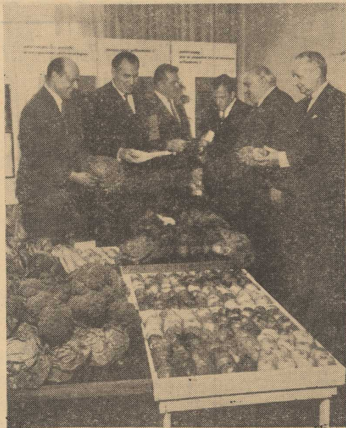
NA ZDJĘCIU: fragment wystawy „Warzywa i owoce na naszym stole”.