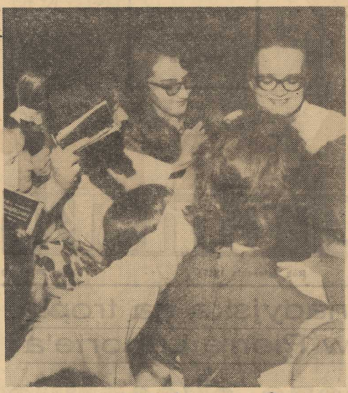
Antoni Bohdziewicz, reżyser filmowy.