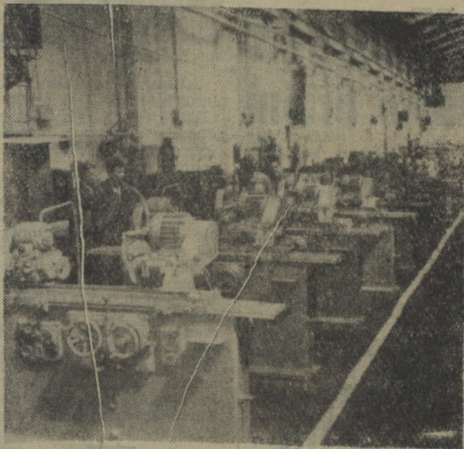
Na zdjęciu: fragment hali montażowej szlifierki SJW-1000 i 1-SMH w Zakładach Mechanicznych im. Strzelczyka w Łodzi.