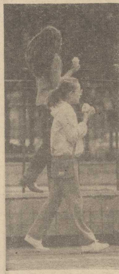
COS SŁODKIEGO...