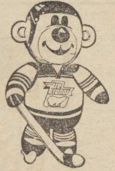
MIS „Izydor” — maskotka hokejowych mistrzostw świata grupy „A”.