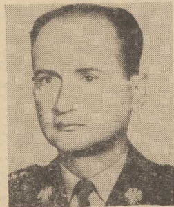
Gen. armii Wojciech Jaruzelski — prezes Rady Ministrów i minister obrony narodowej.