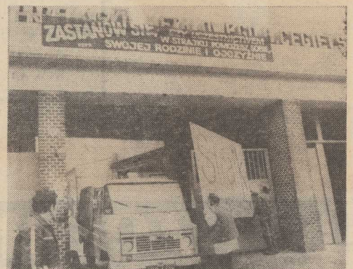
STRAJK ostrzegawczy. Brama główna Zakładów „H. Cegielnik” w Poznaniu kilka minut przed godziną 12.