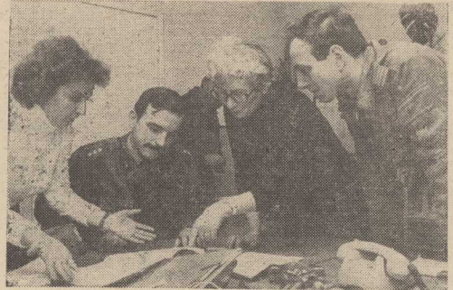
ZOŁNIERZE—DELEGACI rządu w dziale skupu i kontraktacji GS w Policach.

W WOJEWODZTWIE szczecińskim, tak jak w całym kraju, od poniedziałku działają w gminach i miastach — gminach Terenowe Grupy Operacyjne złożone z oficerów i podoficerów Wojska Polskiego.