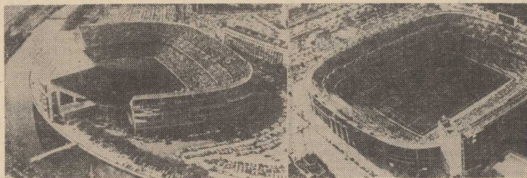
CZTERY stadiony piłkarskich mistrzostw świata 1982. U góry (po lewej) „Vicente Celdron“ i „Santiago Bernabeu“ w Madrycie. Na tym drugim zostanie rozegrany mecz finałowy. U dołu: „Benito Villamarin“ (po lewej) i „Ramon Sanchez, Pizjuan“ oba w Sewilli.

PIŁKARSKA reprezentacja Polski rozegra jeszcze w tym roku trzy mecze międzypaństwowe, z Argentyną (28 bm.) w Buenos Aires, z Maltą (15 listopada) i z Hiszpanią (18 listopada) — w kraju.