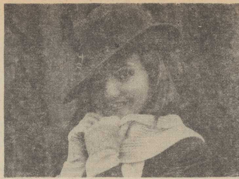
Trochę uśmiechu w pochmurny dzień...

KOSZALIN PAP. Jak dowiaduje się Koszaliński korespondent PAP red. Eugeniusz Buczek, kolegium Okręgowego Urzędu Górniczego w Poznaniu przeszukiwało w charakterze oskarżonych o popełnienie wykroczeń wobec prawa górniczego 6 osób uczestniczących w wydarzeniach, które poprzedziły głośnie na cały kraj strasząc i pożar ropny naftowej oraz gazu ziemnego w szwie „Daszewo 1” pod Karlinem. Osoby te to: szef działu geologii ruchowej Przedsiębiorstwa (Dokończenie na str. 2)