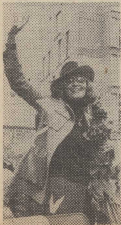
NA DZIS, wtorek 6 bm. TVP zapowiada film „Zagadka dziecka kłęski” z Faye Dunaway (na zdjęciu) w roli głównej.