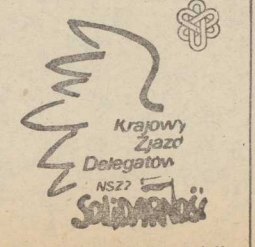
TAK WYGLĄDA EMBLEMAT I KRAJOWEGO ZJAZDU NSZZ „Solidarność”.