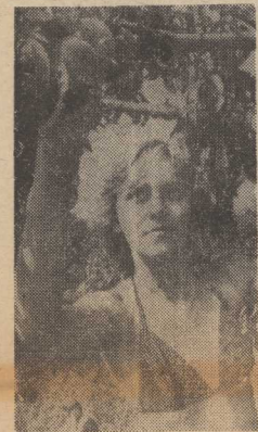
WĘGRY. Nad Balatonem „brozskwinowie żniwa”.