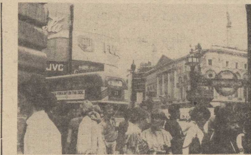
WIELKA BRYTANIA. Piccadilly Circus — najruchliwszy punkt Londynu. Można tu spotkać turystów z całego świata.

Według doniesień z Salisbury, sekretarz generalny Afrykańskiego Kongresu Narodowego Afryki Południowej, Alfred N'go oświadczył, że napasa RPA na