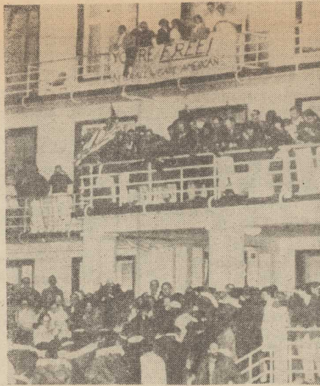
GRUPA zakładników amerykańskich przybywa do szpitala wojskowego w Wiesbaden. Na zdjęciu: moment entuzjastycznego powitania przez personel i pacjentów szpitala.

Pokrowny charakter ma również najnowszy film głośnego reżysera Wernera Fassbindera „Li-