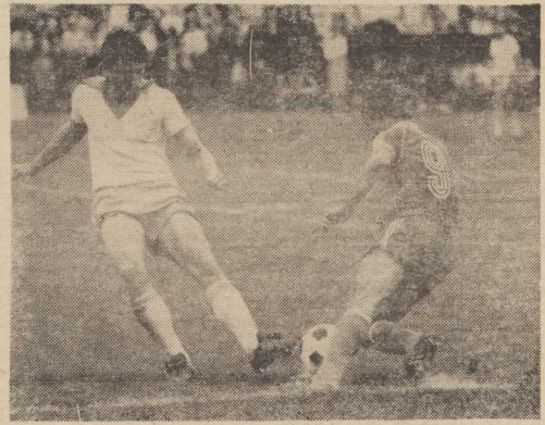
Na zdjęciu: fragment niedzielnego meczu Pogoń — Bałtyk.

A jeśli chodzi o wczorajszą, pechową porażkę — to mam nadzieję, że drużyna wywiąże się z niej odpowiednio wnosząc i w przyszłości nie da się tak łatwo pokonywać. (jg)