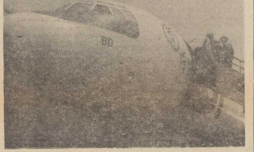
2 BM. odbyła się na warszawskim lotnisku Okęcie uroczystość nadania imienia gen. Władysława Sikorskiego samolotowi Il-62.