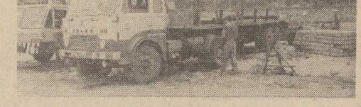
WARSZAWSKI transport trzeba rozładować. Dzięki przysłanym urzędnikom będzie można niebawem przystępować do montażu konstrukcji mostu przez Odrę.

Podsumowując — na budowie Trasy Zamkowej — widać specjalistów z coraz większą liczbą przedsiębiorstw. Obecnie spotkać tam można robotników i inżynierów z SPBB, PPRM, NPBO, KPRL, „EnergoPolu-5” oraz Belchałowsko-Pomorskiego Kombinatoru Budowy Elektrowni i Przemysłu, „Mostostalu” i in. Teraz trzeba tylko jak najmniej kłopotów z materiałami, dokumentacją i partnerami.