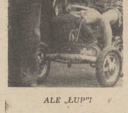
ALE „LUP”!