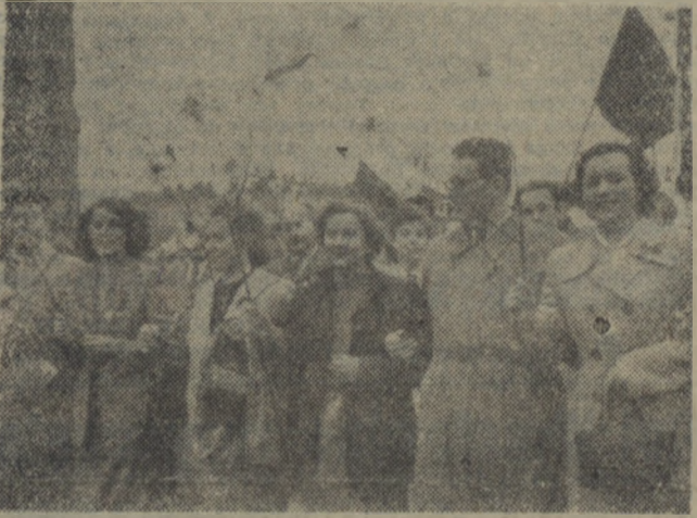
Fragment pochodu.