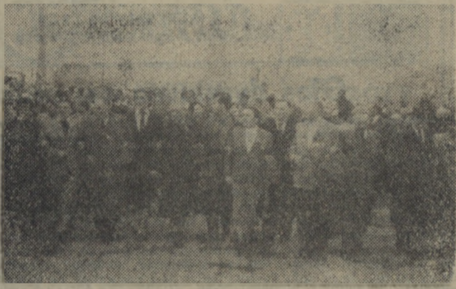
Na zdjęciu: idą weterani ruchu rewolucyjnego.