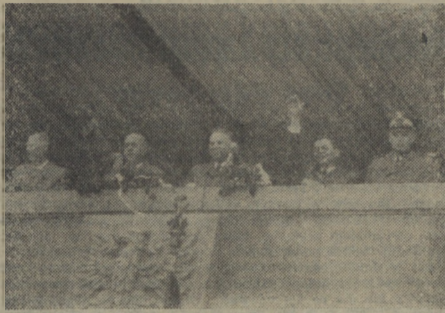
Na zdjęciu: na trybunie honorowej (od lewej) Z. Nowak, J. Cyrankiewicz, E. Ochab, A. Zawadzki, K. Rokossowski.